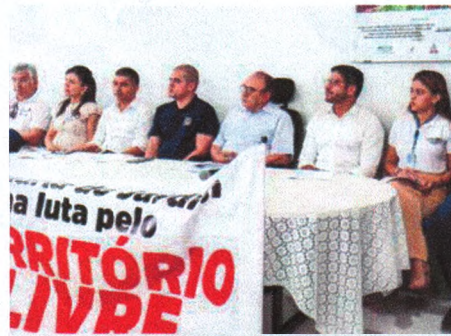
Representantes do Governo do Estado reuniram-se com representantes do movimento das quebradeiras de coco babaçu

Representantes da Casa Civil, Secretaria de Estado da Agricultura Familiar (SAF), Secretaria de Estado do Meio Ambiente (SEMA), Secretaria de Estado dos Direitos Humanos e Participação Popular (Sedihpop), Agência Estadual de Pesquisa Agropecuária e Extensão Rural (Agerp), Secretaria de Igualdade Racial (SEIR) e Assembleia Legislativa estiveram reunidos para definir estratégias e alinhar ideias que viabilizem o atendimento das pautas reivindicadas pelas mulheres quebradeiras de coco babaçu, como a efetivação do processo de regularização fundiária do Território Quilombola de Sesmária do Jardim, localizado nos municípios de Matinha e Olinda Nova, de o Sítio Ramsar, área de proteção ambiental da baixada